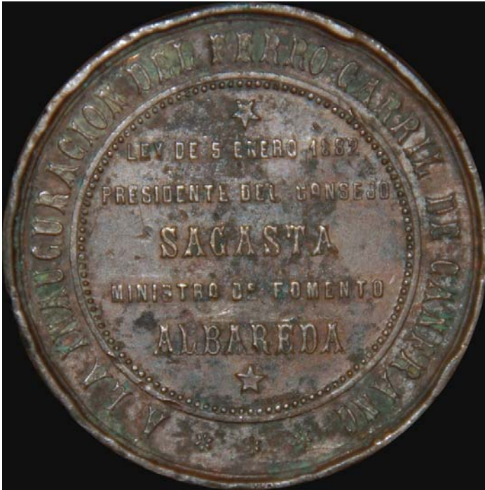
Anverso y Reverso de moneda conmemorativa del comienzo de las obras del Ferrocarril de Canfranc