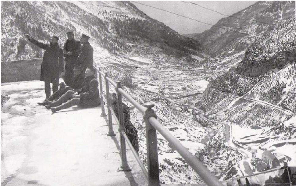
Fuerte de Coll de Ladrones