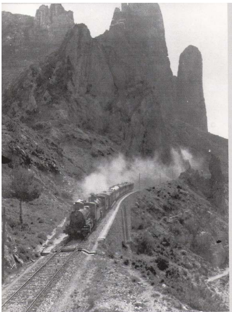
Tren a su paso por Riglos, en uno de los estrechamientos del Gállego

Gállego”. La carretera recién construida le permite llegar a Jaca. Y como esta carretera cambia en esa ciudad bruscamente de rumbo, torciendo hacia el valle del Gállego, podrá o bien encaminarse sin problemas por la canal de Embún hasta Navarra o descender ya, en seis jornadas, hasta Zaragoza. Una vez en Zaragoza, no pasará el Ebro sino que se correrá por la margen izquierda, río arriba y río abajo, tomando de flanco y de revés todas nuestras defensas, como hizo Souchet en la guerra de la Independencia.