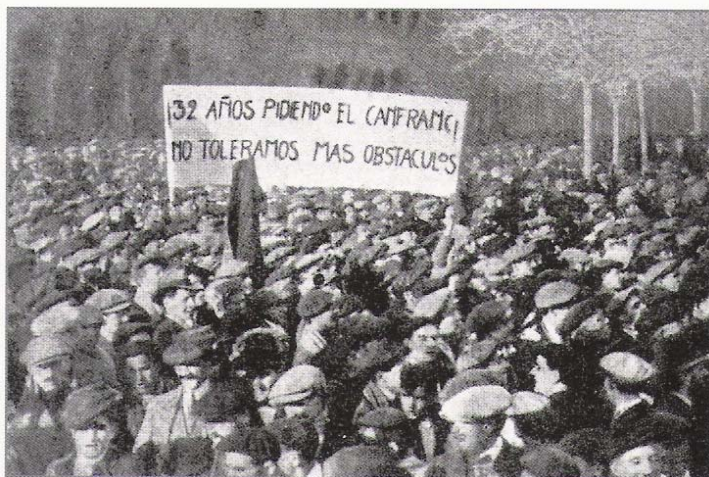
Manifestación reivindicativa del Ferrocarril del Canfranc, año 1914

Esta fantasmagórica alianza había constituido incluso uno de los factores de aquella contienda franco-prusiana, pues cuando se expulsó a Isabel II y quedó vacante el trono de España, pareció que era el príncipe Hohenzollern, primo de Guillermo, el candidato de Prim, a lo que Francia se opuso radicalmente, hiriendo la sensibilidad alemana. En éstas, Bismark, el canciller de hierro, lanzó sobre París un telegrama equívoco, desconocido al parecer por el mismo Kaiser , que sabía que provocaría una declaración de guerra por parte de los franceses. Los alemanes se fingieron más heridos de lo que realmente estaban, porque lo que pretendían era suscitar una confrontación para la que se sentían preparados. Nosotros, a quienes en aquella lotería monárquica nos tocó luego ser súbditos fugaces de D. Amadeo de Saboya, al parecer ni entrábamos ni salíamos en estos manejos.