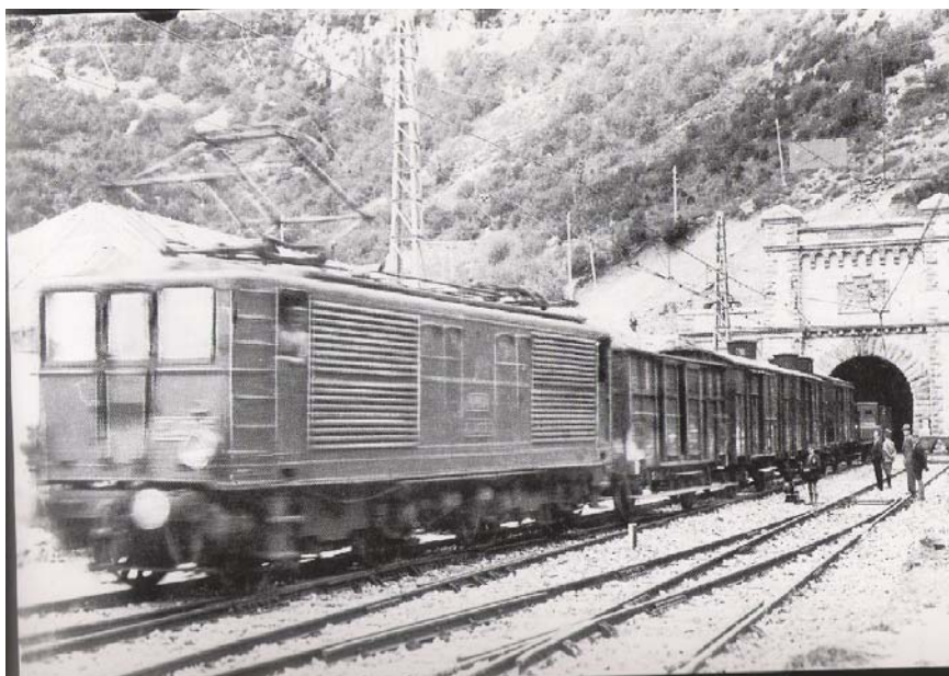
Entrada española al túnel internacional

río Aragón, la reforestación de la garganta del Canfranc y la estación internacional. Se abrió la comunicación con Francia el 18 de julio de 1928.